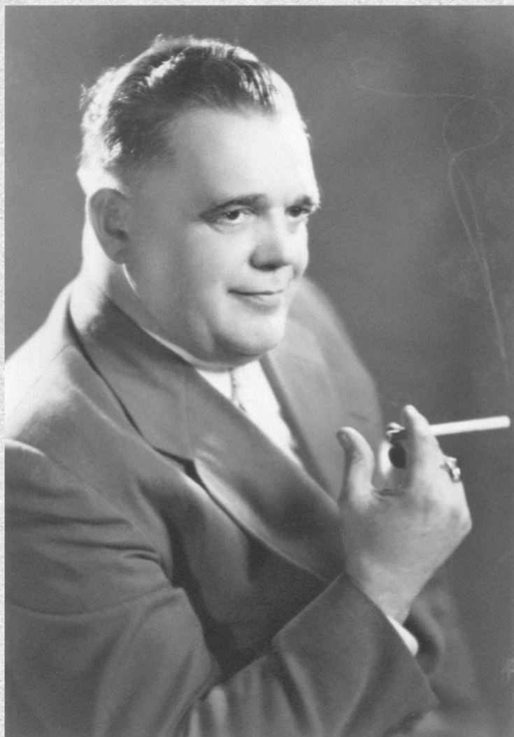
Франц Бардон — 1952 год